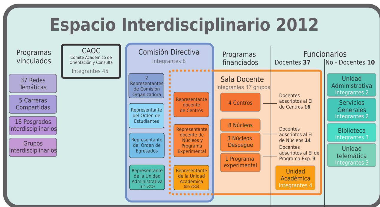
Figura 1 - Estructura del Espacio Interdisciplinario

El Consejo Directivo Central (CDC) resolvió la conformación del Espacio Interdisciplinario de la UDELAR con tres objetivos específicos: dotarlo de una infraestructura física, informática y administrativa adecuadas, ponerlo al servicio de la coordinación de diversas actividades de enseñanza y constituir equipos académicos activos que impulsen su avance. Para ello, la Universidad crea dos estructuras académicas: el Comité Académico de Orientación y Consulta (CAOC) 3 del EI - integrado por cuarenta y cinco académicos de notable trayectoria - y la Comisión Organizadora del EI (COEI) 4 , que dará lugar a la actual Comisión Directiva (CD) 5 cogobernada (Figura 1).